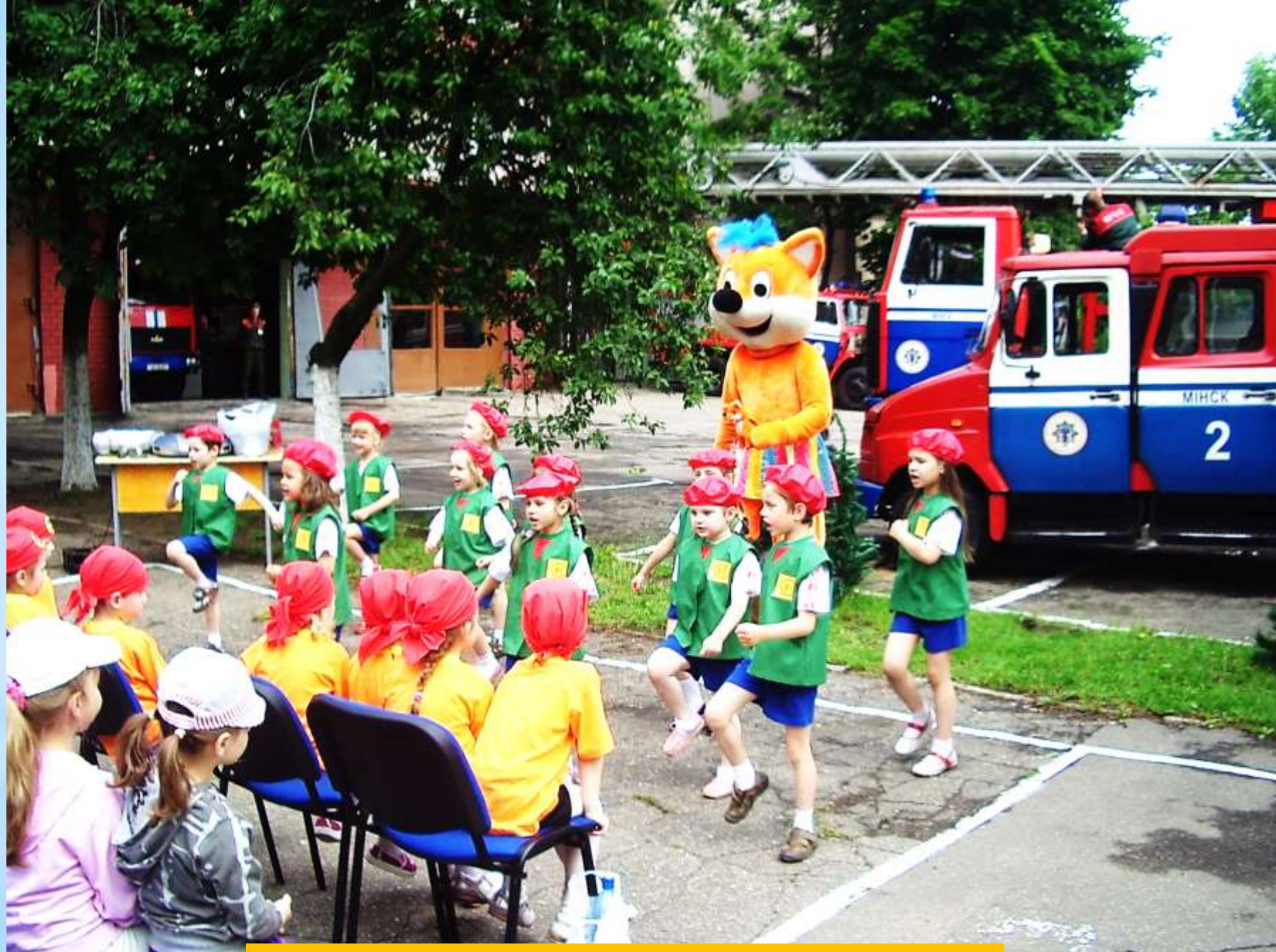
Тренировка «Юных спасателей»